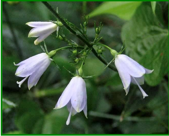
ツリガネニンジン（キキョウ科） めしべが長く突き出ています。