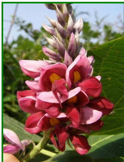
クズ(マメ科) 秋の七草の一つです。