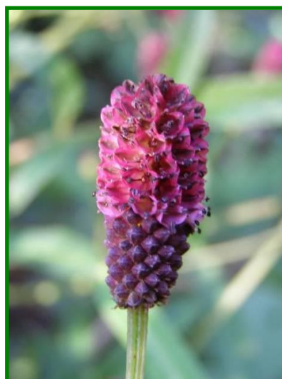
ワレモコウ(バラ科) 小さな花が上から下へ開花してゆき