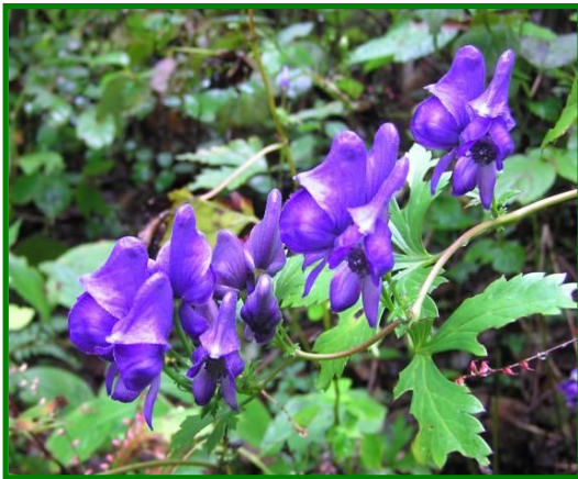
ツクバトリカブト（キンポウゲ科） 鳥 の兜です。この根からとった毒は縄文時 代から毒矢に使われました。