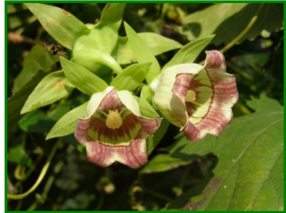
ツルニンジン（キキョウ科） 別名の「ジイソブ」は爺さんの そばかすという意味です。