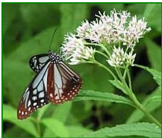
ヒヨドリバナ (キク科) アサギマダラ の好物です。