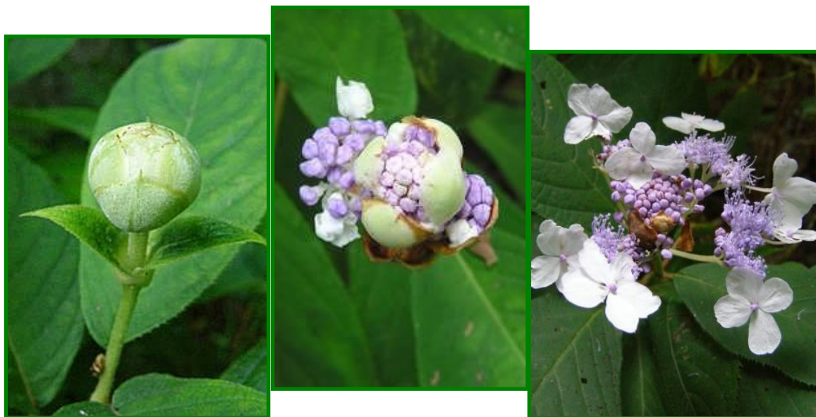
タマアジサイ (ユキノシタ科) 丸いつぼみが弾けて白の装飾花が飛び出します。