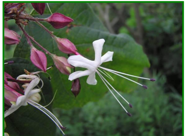
クサギ（クマツヅラ科） 良い香りの花と、 赤と藍色のきれいな実をつけます。